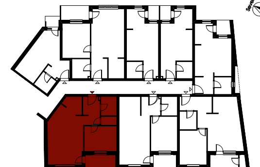
Ulica Matije Gupca