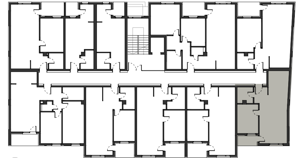
osnova sprata - položaj stana